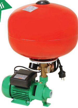
HM H 70 C