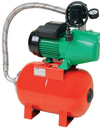
HMJ H 15 C