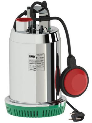
HD 700 P